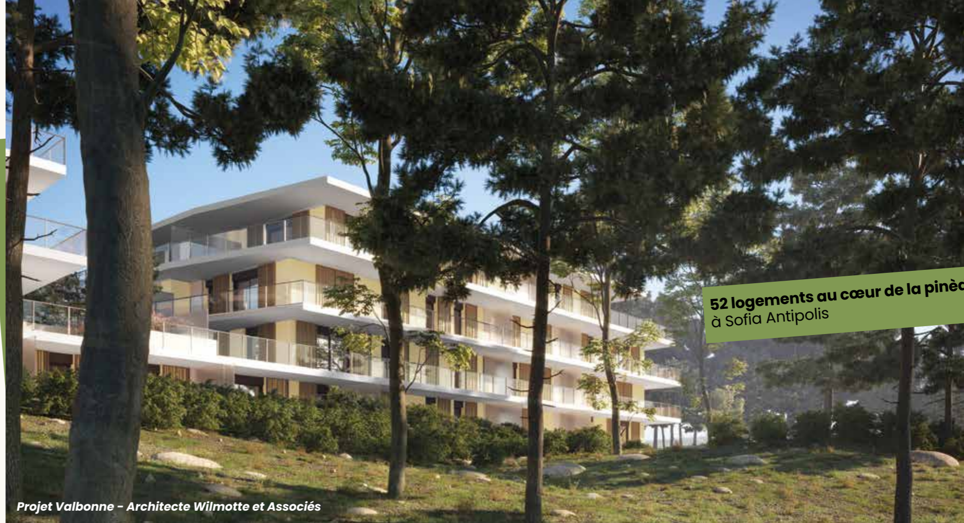
Projet Valbonne - Architecte Wilmotte et Associés

52 logements au cœur de la pinède, à Sofia Antipolis