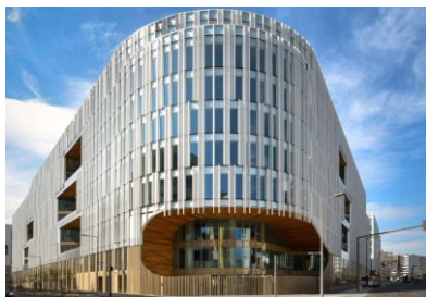
1. Origine à Nanterre (92)

3. Ce projet vise une haute performance environnementale, avec un bilan carbone divisé par 2 par rapport à un projet classique (698 kg CO 2 /m 2 ), 10% de matériaux issus du réemploi, une forêt urbaine de 3000 m 2 . Il permettra une mixité sociale avec une résidence sociale ciblant en priorité des personnes en situation de handicap et une résidence étudiante de 149 chambres.