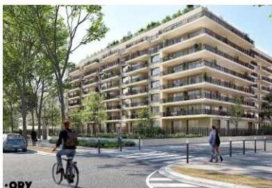
2. 58 Victor Hugo à Neuilly-sur-Seine (92) - AfterWork by Icade