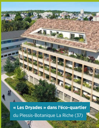
« Les Dryades » dans l'éco-quartier du Plessis-Botanique La Riche (37)