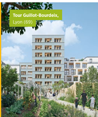
Tour Guillot-Bourdeix, Lyon (69)

Urban Odyssey, le start-up studio d'Icade, au service de ses métiers, propose depuis 2019 des solutions concrètes pour décarboner la ville à 2050.