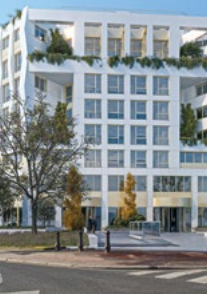
City Park, Levallois-Perret (92)