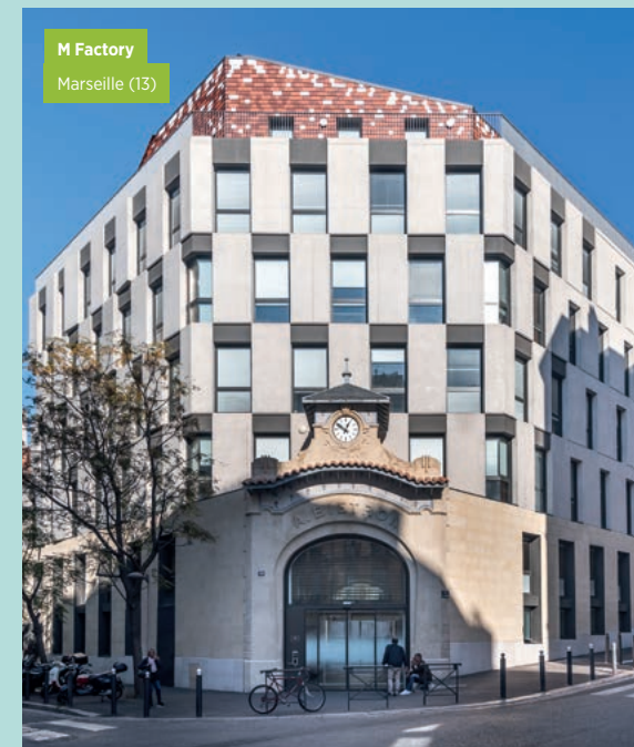
M Factory Marseille (13)

La porte Biétron, élément patrimonial protégé, a été soigneusement restaurée et intégrée comme un élément à part entière de l'immeuble de bureaux. Dernier vestige des plus beaux exemples de l'architecture industrielle marseillaise du XX e siècle, elle s'ouvre aujourd'hui sur une rue intérieure dévoilant un chemin solennel jusqu'au cœur d'îlot.