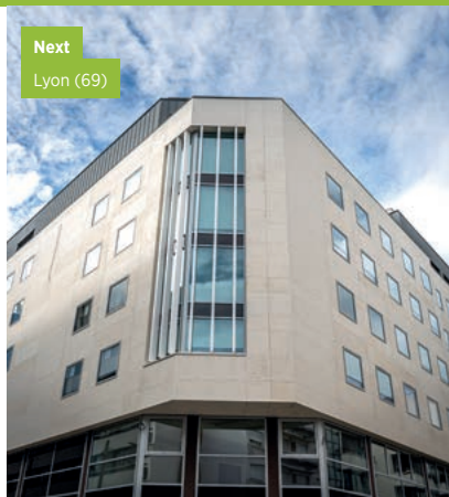
Next Lyon (69)

Dans l'immeuble Next, sur une superficie de 2 000 m 2 , l'offre Imagin'Office propose deux cents postes de travail dans des bureaux privatifs ou des plateaux sur-mesure. Imagin'Office, ce sont des espaces de travail flexibles, personnalisés, clé en main et évolutifs selon les besoins des clients.