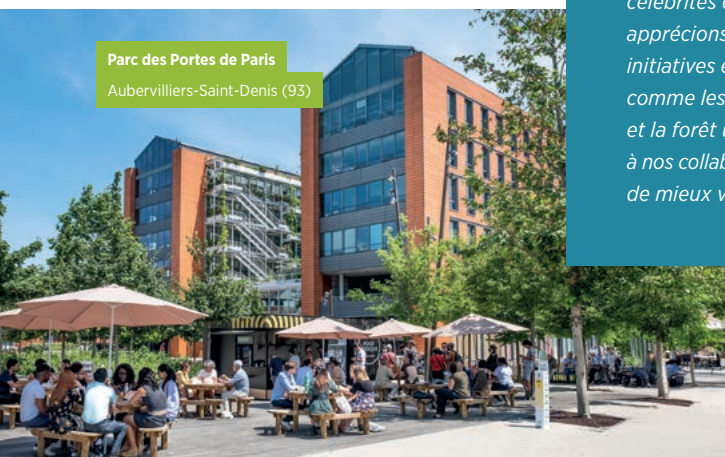
Parc des Portes de Paris Aubervilliers-Saint-Denis (93)

Situé à 7 kilomètres de Paris avec un accès direct depuis l'A106, le Parc Paris Orly-Rungis est le premier parc tertiaire privé du sud de Paris. S'étendant sur 58 hectares , il accueille aujourd'hui plus de 220 entreprises et environ 15 000 collaborateurs , avec une grande flexibilité d'usages. Les services, animations, offres de restauration et espaces de détente du parc offrent à ses usagers une belle qualité de vie au travail, dans des espaces connectés, dynamiques et mixtes.