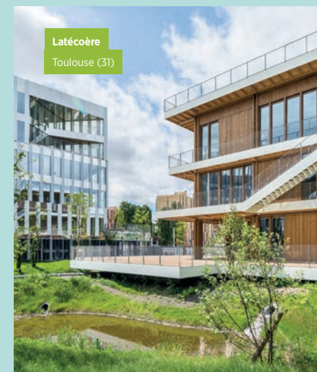
Latécoère Toulouse (31)

situé au pied de la station de métro « Roseraie » à Toulouse. Siège de l'équipementier aéronautique du même nom, cet ensemble verre et métal est situé à côté d'une maison des services de plus de 2 000 m 2 construite totalement en bois et qui regroupe l'ensemble des services communs de Latécoère.