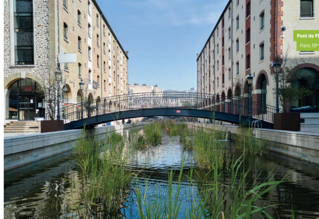
Pont de Flandre Paris 19 ème (75)

Situé à 7 kilomètres de Paris avec un accès direct depuis l'A106, le Parc Paris Orly-Rungis est le premier parc tertiaire privé du sud de Paris. S'étendant sur 58 hectares , il accueille aujourd'hui plus de 220 entreprises et environ 15 000 collaborateurs , avec une grande flexibilité d'usages. Les services, animations, offres de restauration et espaces de détente du parc offrent à ses usagers une belle qualité de vie au travail, dans des espaces connectés, dynamiques et mixtes.