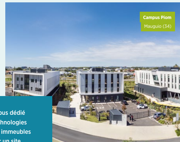
Campus Piom Mauguio (34)

Campus Piom est un campus dédié aux "soft industries", technologies et services. Il comprend 7 immeubles sur 30 000 m 2 répartis sur un site de 7 hectares.