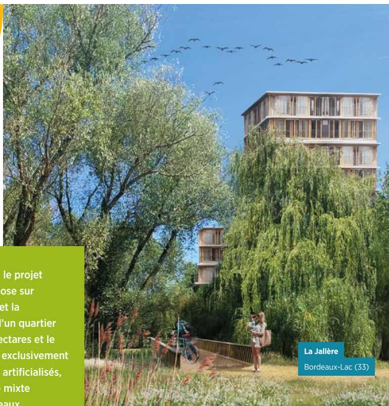
La Jallère Bordeaux-Lac (33)

La démarche de valorisation des emprises foncières peut résulter d'initiatives des propriétaires de terrains eux-mêmes (cession ou restructuration de patrimoine), ou de projets de développement urbain menés par les villes concernées. Acteur de la ville, Icade met au service des opérations les plus complexes une expertise complète héritée de son expérience de terrain.